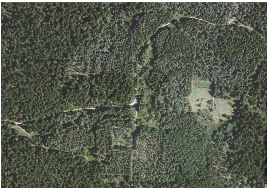
Photo aérienne du même lieu de la Mathe prise en 2012. On retrouve le chemin qui serpente pour monter au Feltin, noyé dans la forêt qui a remplacé les terres cultivées. Les habitations n'existent plus.