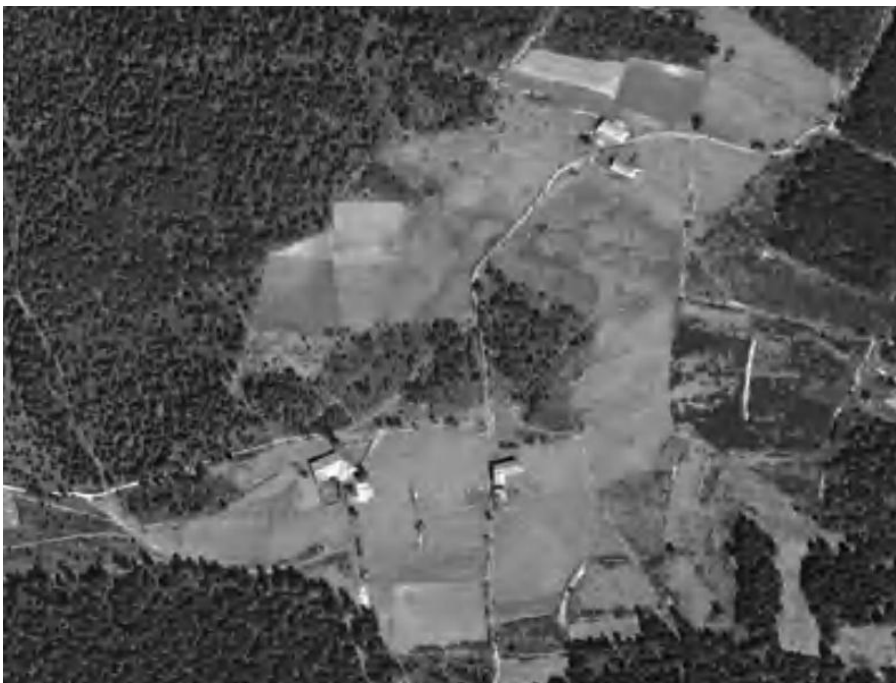
Photo aérienne du hameau de la Mathe prise en 1947. On peut observer les habitations entourées de terres cultivées et le chemin qui monte au Feltin.